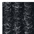
antracite n° 200