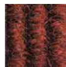
rosso n° 305