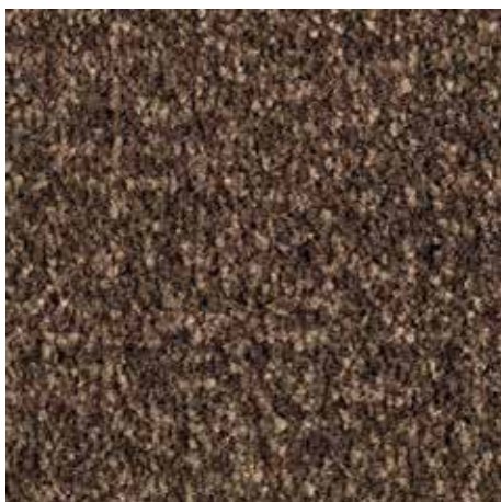
sfumature di marrone 81.04