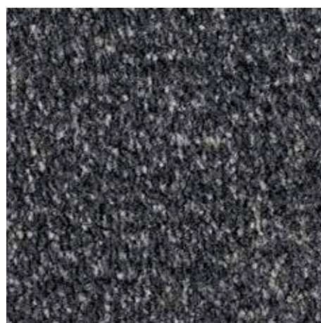
sfumature di antracite 81.02