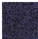
I280 azul acero