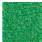
I240 verde caña