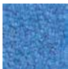
I170 azul claro