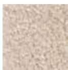
I340 beige agrisado