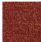
I70 rojo óxido