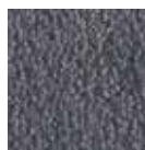
I350 gris azulado