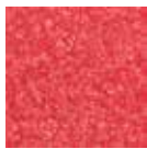
I90 rojo claro