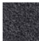
I380 gris oscuro