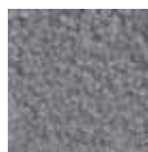
I360 gris claro