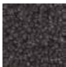
I410 gris acero