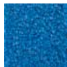
I290 azul lumi- noso