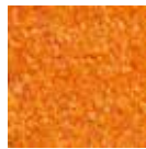
I30 amarillo naranja