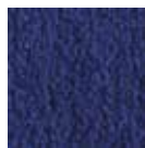
I200 azul marino