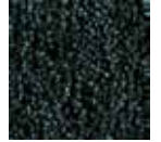
C50 koyu mavi