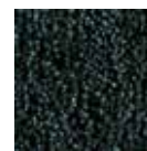
C50 tmavě modrá