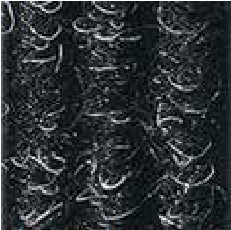
Antracita nº 200