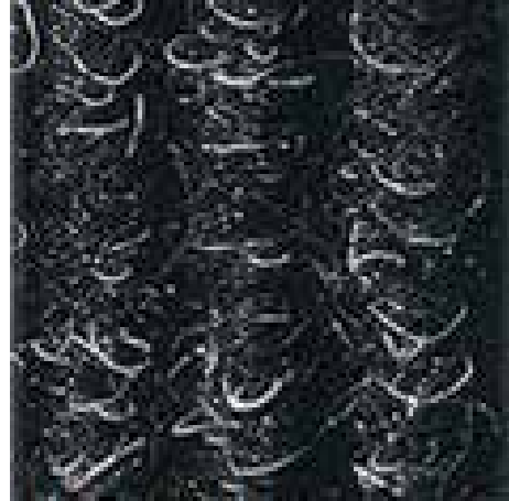
Antracita nº 200