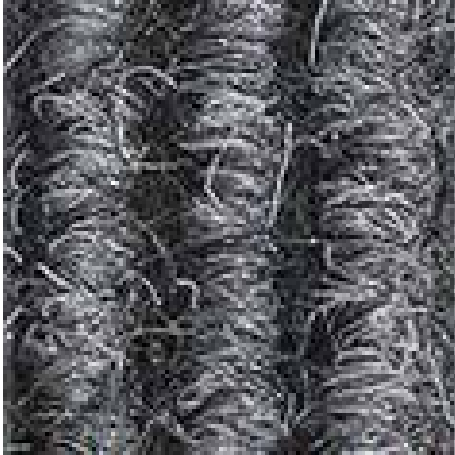
Gris claro nº 220