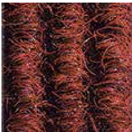
красный № 305