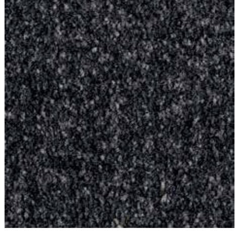
desenli siyah 81.01