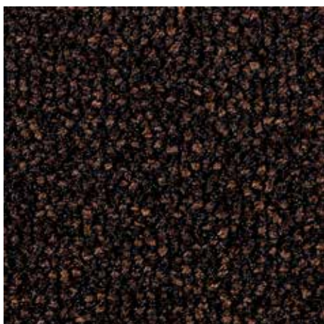
47.03 rjave barve