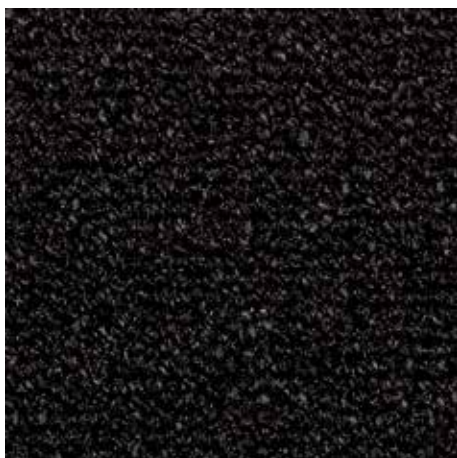
47.01 antracitne barve