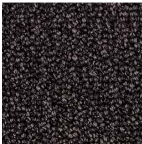
47.02 sive barve