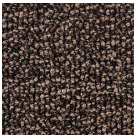
47.04 bež barve