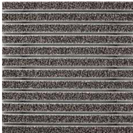
47.04 bež barve