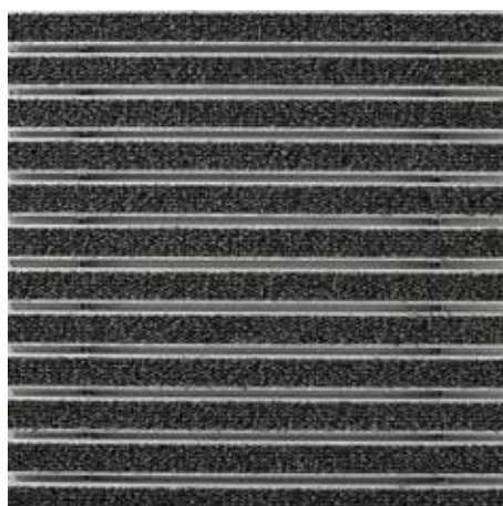
47.02 sive barve

Pridržujemo si pravico do tehničnih sprememb