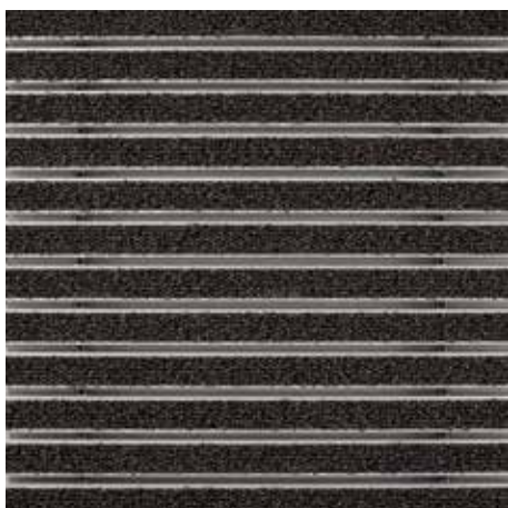
47.03 rjave barve