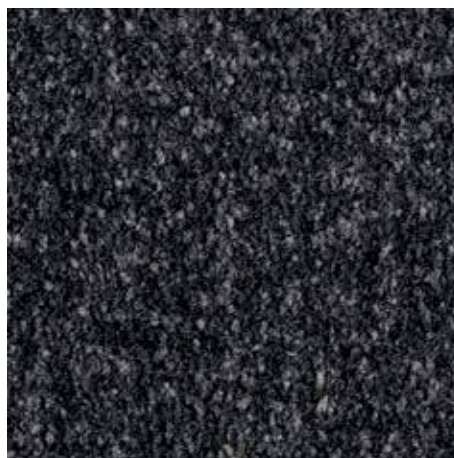
черный с рисунком 81.01