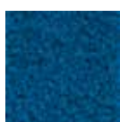
I 180 Pétrole