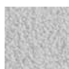
I 300 Argenté