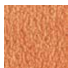
I 50 Terracotta