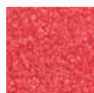
I 90 Rouge clair