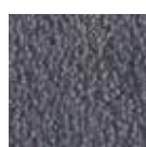
I 350 Bleu gris