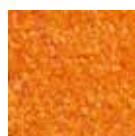
I 30 Jaune orange