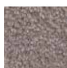
I 270 Graphite