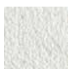
I 400 Blanc*