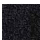
I 390 Noir