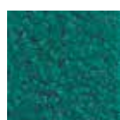
I 190 Émeraude