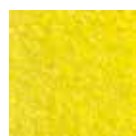
I 10 Citron