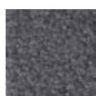
I 370 Gris