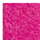
I 140 Magenta