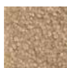
I 320 Sable