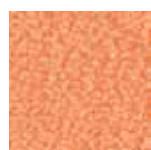
I 150 Pêche