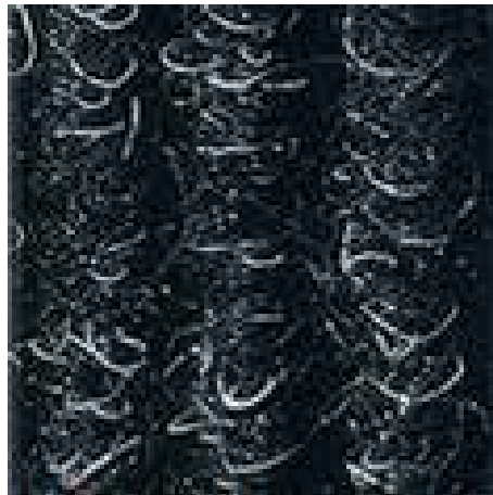
antracit št. 200