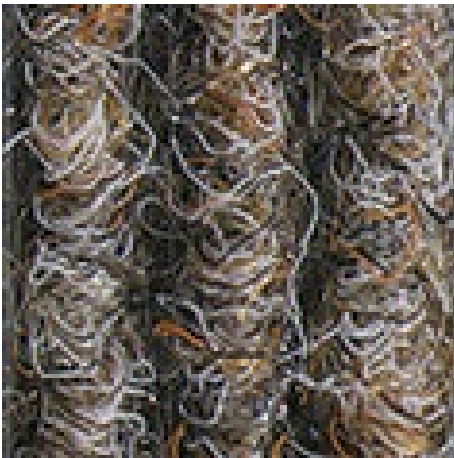
kum rengi no: 430