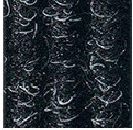
antrasit No 200