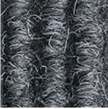
açık gri No.220