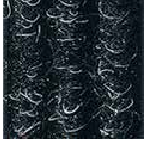
antrasit No 200