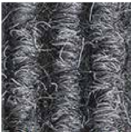
Jasnoszary nr 220