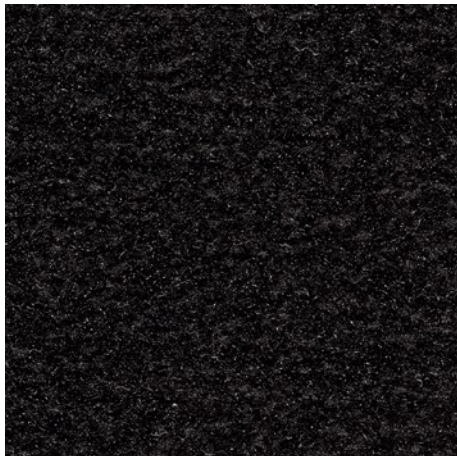
36.01 črne barve