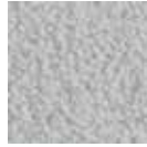
i 300 gümüş