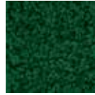
i 210 koyu yeşil