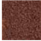
i 310 karaca kahve rengi