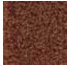
i 260 kahve