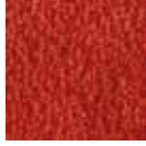
i 100 kiraz rengi