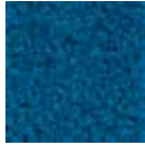
i 180 petrol mavisi