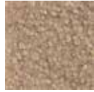
i 320 kum rengi