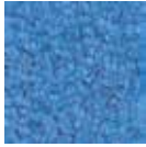
i 170 açık mavi