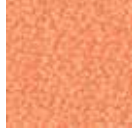
i 150 şeftali