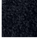
i 390 siyah