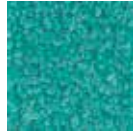
i 220 nane rengi