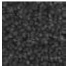
i 410 çelik gri