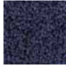
i 280 çelik mavi