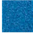
i 290 ışık mavisi