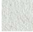
i 400 beyaz