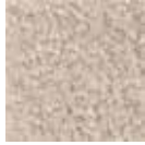
i 340 gri bej