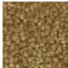
i 420 altın rengi