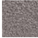
i 270 grafit