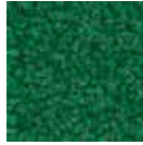
i 230 yaprak yeşili