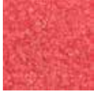
i 90 açık kırmızı