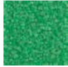
i 240 kamış yeşili