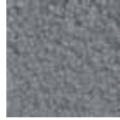
i 360 açık gri