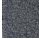
i 370 gri