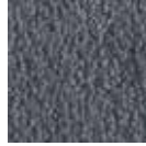
i 350 mavi gri