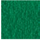
i 250 yeşil