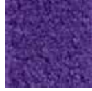
i 130 üzüm rengi