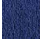
i 200 lacivert