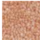
i 430 somon rengi