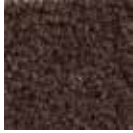
i 330 maron rengi