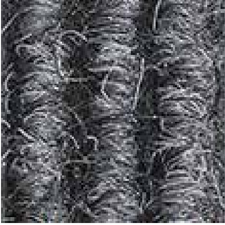
aık gri No.220