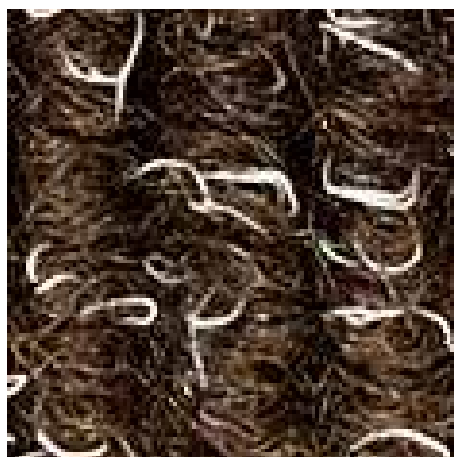
bruin nr. 485