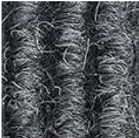
nr. 220, lichtgrijs