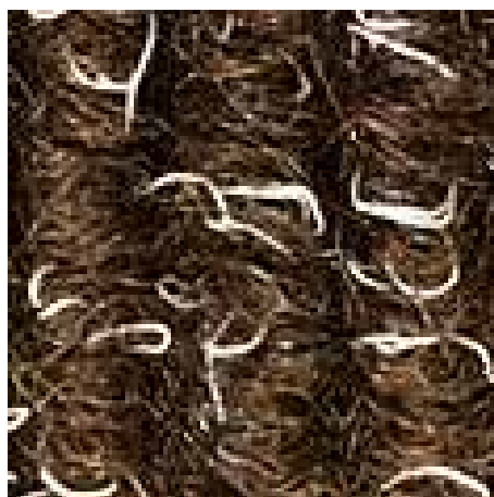
Braun Nr. 485