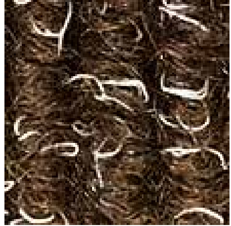
kahverengi No. 485