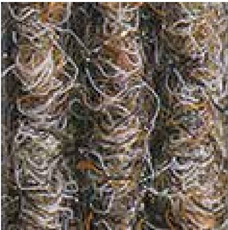
kum rengi no: 430