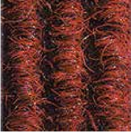
kırmızı No. 305