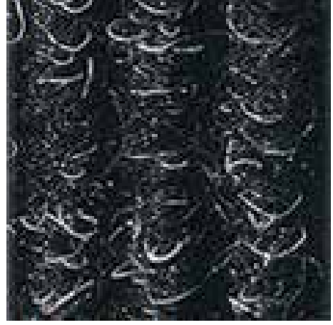
antrasit No 200