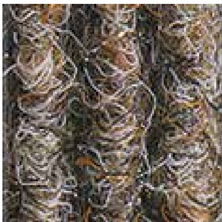
peščena št. 430

Pridržujemo si pravico do tehničnih sprememb