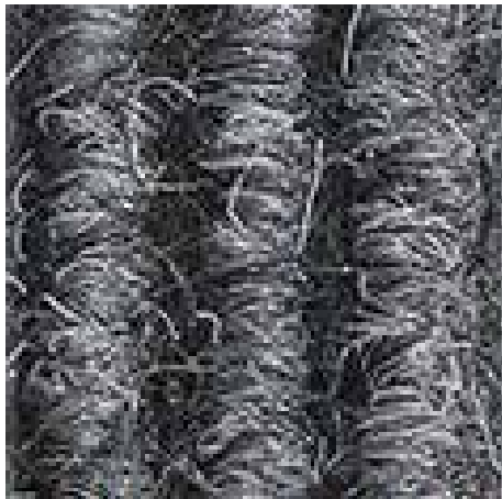
svetlo siva št.220