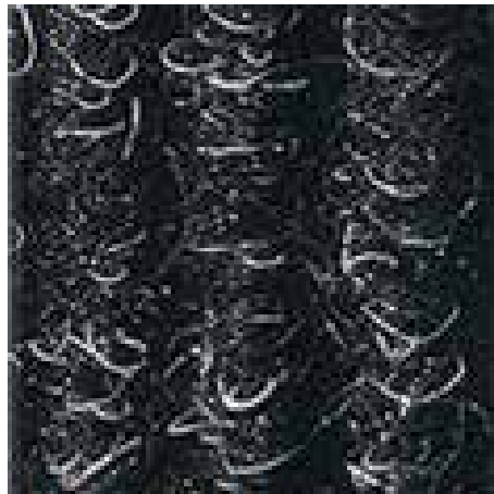
antracit št. 200