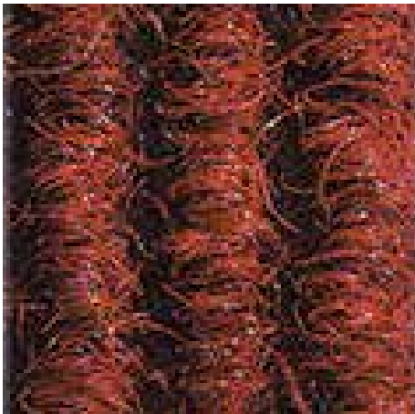
Rot Nr. 305