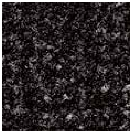
sfumature di nero 81.01