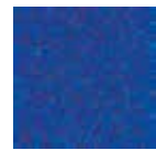
I160 kraljevsko modra