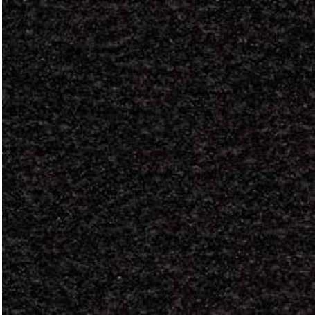
36.01 črne barve