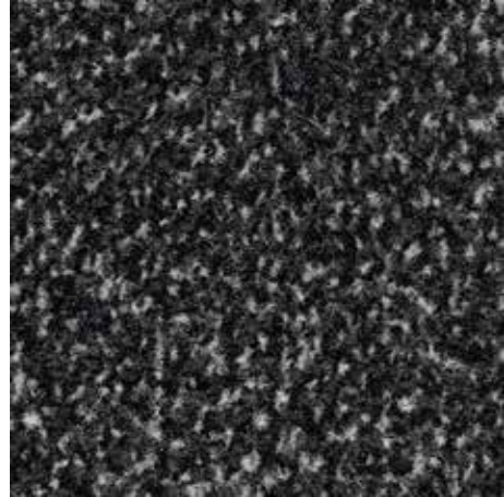
36.02 antracitne barve