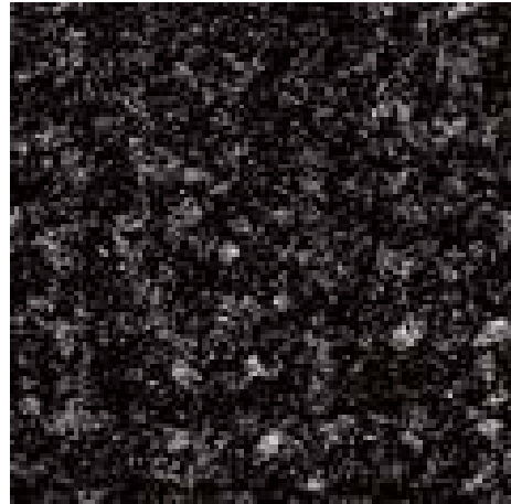
Schwarz dessinert 81.01