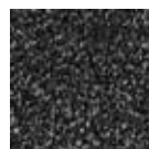
36.02 antracitne barve