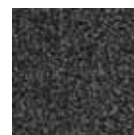
36.03 sive barve