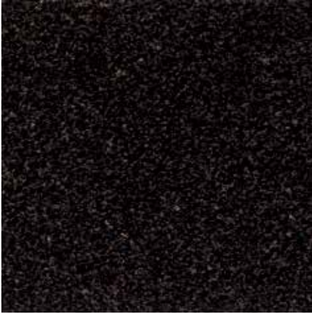
76.04 kahve rengi