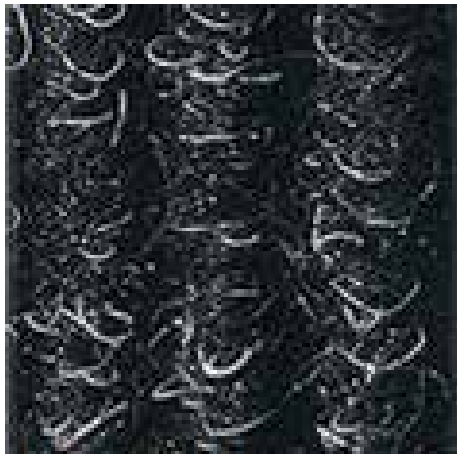
антрацитовый № 200