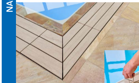
emco Typ 723 DESIGN mit vom Eigentümer ausgewählten Fliesen