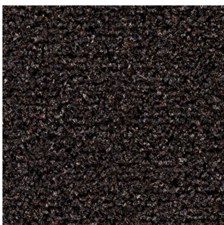
61.03 rjave barve