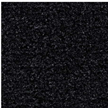
61.01 antracitne barve