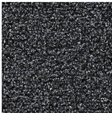
61.02 sive barve