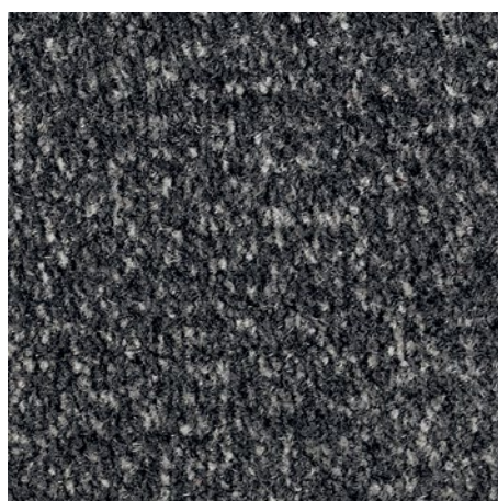
sfumature di antracite 81.02