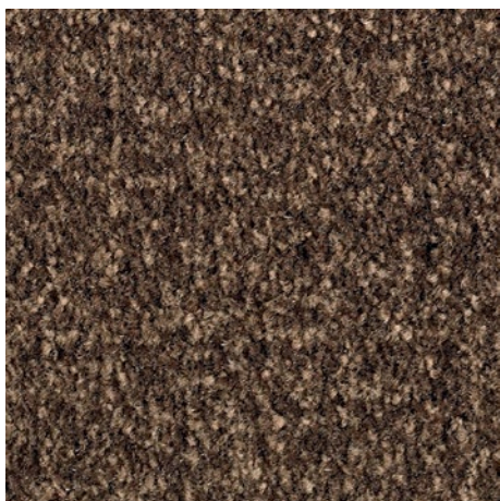
sfumature di marrone 81.04