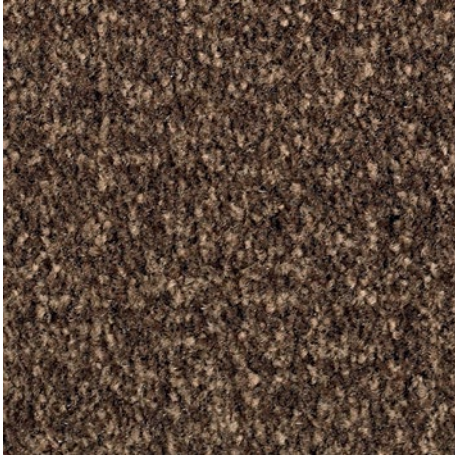
Braun dessinert 81.04