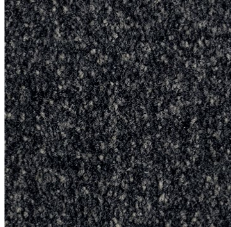
Czarny ze wzorem 81.01