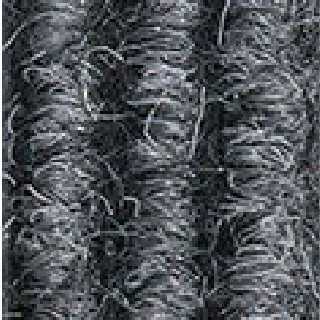
Hellgrau Nr. 220