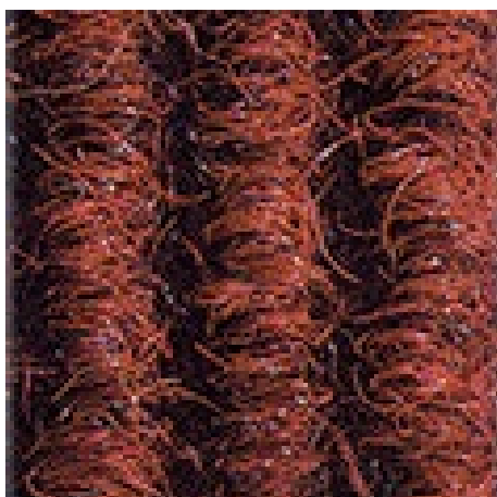
rood nr. 305