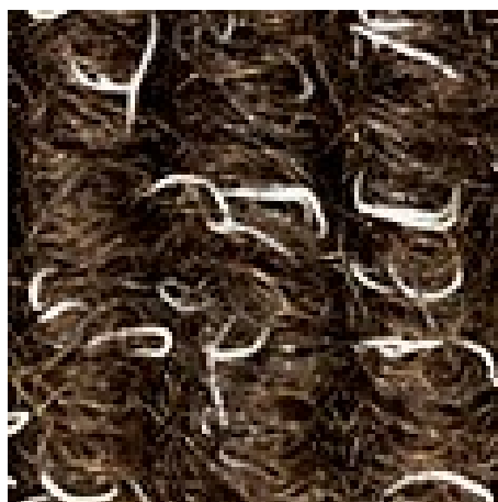
bruin nr. 485