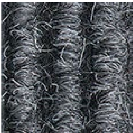
nr. 220, lichtgrijs