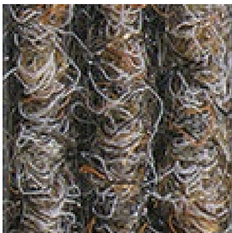
peščena št. 430

Pridržujemo si pravico do tehničnih sprememb