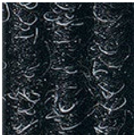
antracit št. 200