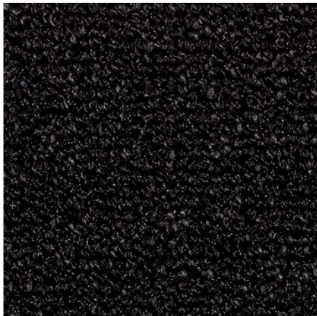
47.01 antracitne barve