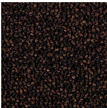
47.03 rjave barve