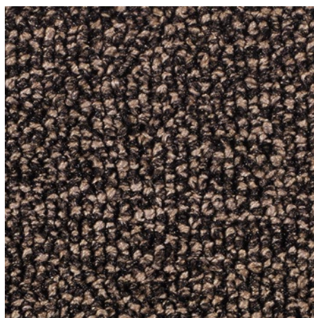
47.04 bež barve

Garancijski pogoji so na voljo na spletni povezavi: www.emco-bau.com/sl/garancijski-pogoji-vhodnih-predpraznikov-emco/