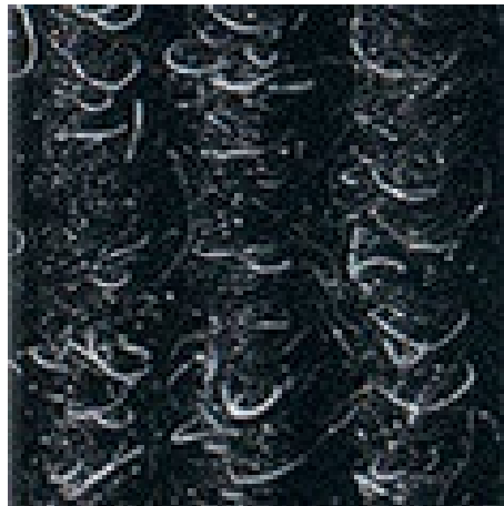
Anthrazit Nr. 200