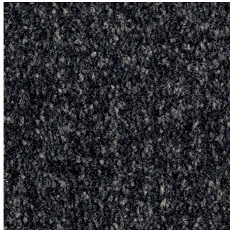
Czarny ze wzorem 81.01