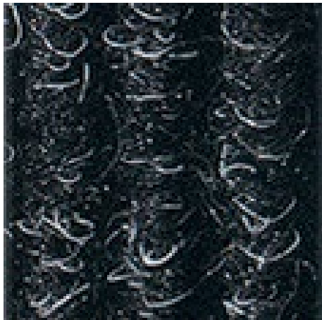
antracit št. 200

Garancijski pogoji so na voljo na spletni povezavi: www.emco-bau.com/sl/garancijski-pogoj-vhodnih-predpraznikov-emco/