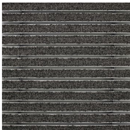
sfumature di nero 81.01