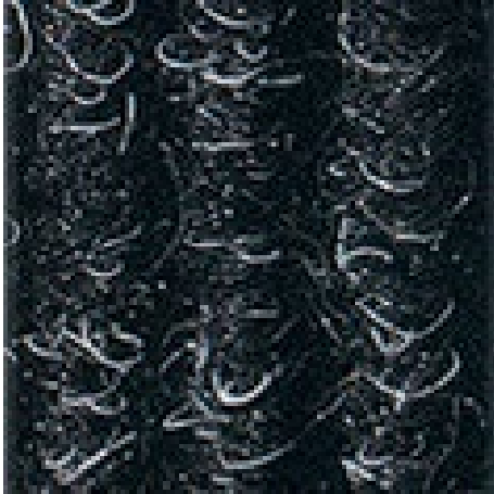
Anthrazit Nr. 200

Garantiebedingungen finden Sie unter: www.emco-bau.com/garantiebedingungen/