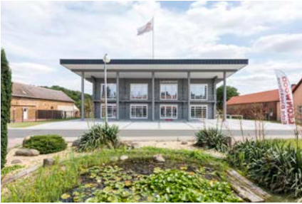
Bild 1 Die neu gebaute Firmenzentrale der Léon Wood® Holz-Blockhaus GmbH Teichland, Brandenburg.