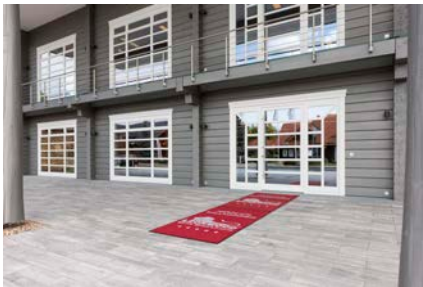
Bild 2 Die individuelle Eingangsmatte im Corporate Design der Marke.